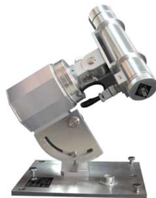
一级标准直接辐射表

产品名称：直接辐射表 别名：直接日射表 产品型号：TBS-2-B-I 产品品牌：HSC 北京华创维想科技开发有限责任公司