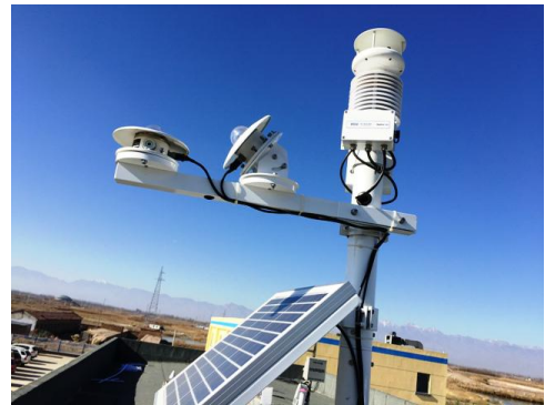
☑ 光伏发电效率评估