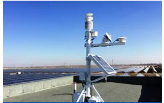
光伏效率指标监测

产品名称：光伏效率监测站 别名：光电转换监测站 产品型号：WSP50 产品品牌：WeatherLog 北京华创维想科技开发有限责任公司